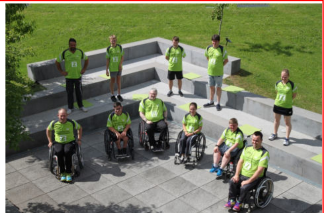
Corona gerechtes Mannschaftsfoto des Frickenhausener Para-Teams

Einen ausführlichen Bericht finden Sie hier